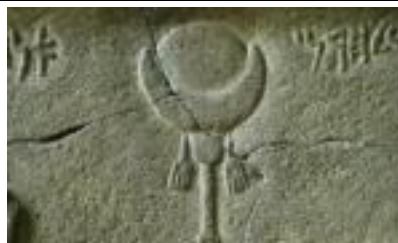
Ősi asszír Baál-félhold