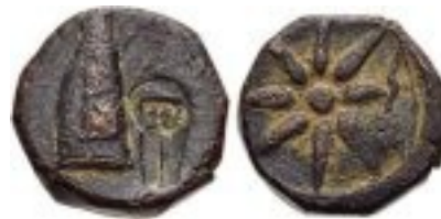
Ősi görög pénzérme nyolcágú csillaggal