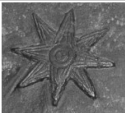
Istár Istennő csillagának ősi sumér ábrázolása