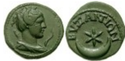
Ősi Pogány bizánci pénzérme