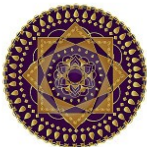
Hindu mandala, mely Lakshmi Istennő nyolcágú csillagát ábrázolja