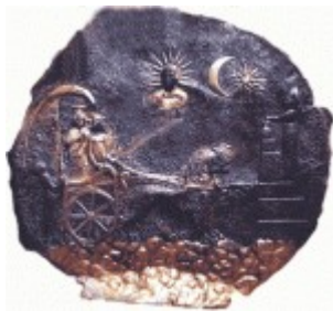
Ősi babilóni ábrázolás

Nyilvánvaló hogy ez a szimbólum NEM az iszlámtól ered. A félhold és a csillag jelképe nagyon Ősi szimbólum, és minden Ősi Pogány kultúrában megtalálható volt, szerte a világban. Ez egy fontos és erős alkímiai szimbólum, mely a harmadik szemre és a hatodik csakrára, valamint a lélek Női Felére utal.