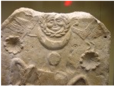
Ősi hettita félhold és Nap