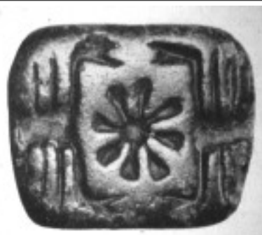
Inanna Istennő csillagának ősi babilóni ábrázolása