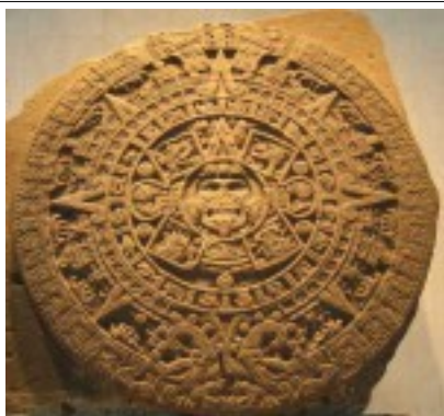
Ősi azték kalendárium – figyeljük meg a nyolc napsugarat

A nyolcágú csillag egy Pogány szimbólum, melyet az Ősi Világban mindenhol a nagy hatalommal azonosítottak. Ez volt Inanna/Astaroth Istennő, valamint Vénusz szimbóluma. A szívcsakrát jelképezi, amely megerősített állapotában nyolc sugarat bocsájt ki magából, összekötve a lélek 13 fő csakráját.