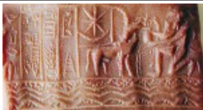
Ősi sumér félhold és csillag